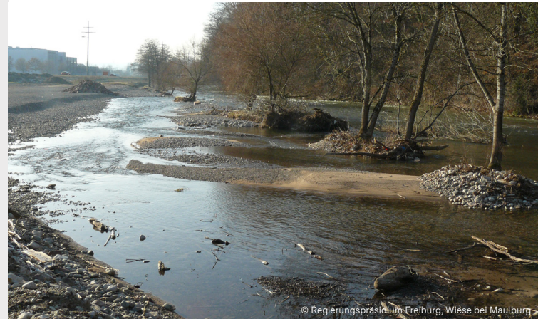
© Regierungspräsidium Freiburg, Wiese bei Maulburg

https://rp.baden-wuerttemberg.de/themen/wirtschaft/foerderungen/fb87/gewaessarentwicklung/